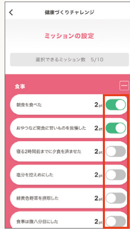
取り組むミッションのトグルボタンをON