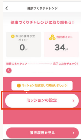
「ミッションの設定」ボタンをタップ