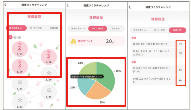
獲得履歴は過去のポイント・ポイント内訳・記録日数別に確認ができます