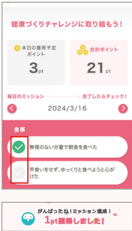
達成したミッションにチェック