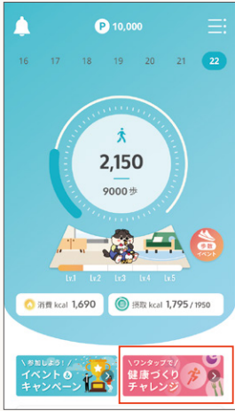
ホームの健康づくりチャレンジをタップ