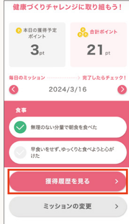
獲得履歴を見るをタップ